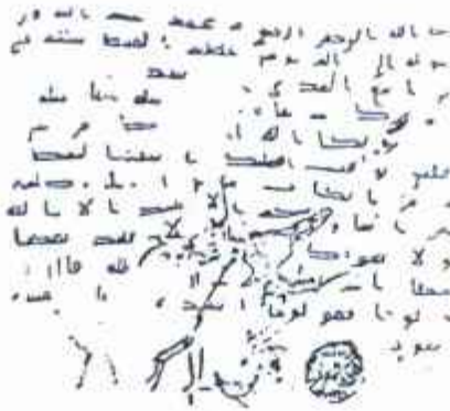
صورت کتاب اللہ ﷺ إلى القوقس عظيم الأباط في الإسكندرية معلقة في متحف طوباقو - استنبول.

اس کو ایک خالص سونے سے تیار کئے گئے صندوقچہ میں رکھا جسے پُرکشش سجاوٹوں سے آراستہ کیا گیا تھا۔