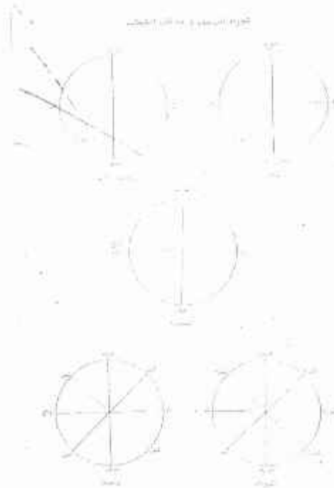
قرآن کے دس حصوں کی شکل

مریم پر منتہی ہوتا ہے جبکہ چوتھا حصہ سورہ یس سے شروع ہو کر آخر قرآن تک ہے؛ یہ ترتیب (چار حصوں میں تقسیم کیا جانا) مشرق میں رہنے والوں کے لئے حیرت انگیز ہے۔ روزانہ تلاوت کئے جانے والے قرآنی حصہ کو رکوع سے تعبیر کرتے ہیں۔ باقاعدہ یہ معلوم نہیں ہو سکا کہ اس تقسیم کا سہرا کس کے سر ہے؟ البتہ معلوم ہوتا ہے کہ یہ انفرادی کاوش ہے جو ذاتی غرض کے تحت وجود میں آئی۔ نیز منقول ہے کہ سب سے پہلے قرآن کو دس حصوں میں تقسیم کرنے والا مامون عباسی (۱۶۷ھ-۲۱۸ھ) ہے جو بغداد میں بنو بیت الحکمت کا ایک دانشمند عباسی خلیفہ تھا اور افریق کی تہذیب و ثقافت کے لئے کوشاں تھا۔ ۲۱۴ھ میں اس نے مسئلہ ”تخلیق قرآن“ کو قومی عقیدہ قرار دے دیا تھا جو معتزلہ فرقہ کی تائید اور فرقہ اشاعرہ کی تذلیل کی جانب ایک اقدام تھا اور اس کے لئے انہیں ایک آزمائش سے گزرنا پڑا کہ یہ فتنہ طوطوں میں مامون کی وفات پر ۲۱۸ھ میں منتہی ہوا، اس لئے کہ اس کی قبر ترکی میں واقع ہے جو ”مامون آغا“ کے نام سے جانی جاتی ہے۔ قرآن کی دس حصوں کی تقسیم کا اثر آج بھی برقرار ہے۔