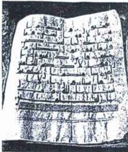
منحة من القرآن الكريم النسوب إلى الإمام علي بن أبي طالب عليه السلام على الآيات ۲۱-۲۲ من سورة التوبة المحفوظة في مسجد رأس الحسين عليه السلام في قرية غلقات الرسول ﷺ بالقاهرة

عواد کہتا ہے: ”یہ وہ نسخہ ہے جسے ”مصحف علی“ کے نام سے جانا جاتا ہے“ یہ جھٹکی پر خط کوئی میں لکھا گیا ہے اور یہ صفحہ ۱۲۲-۱۲۳ پر مشتمل ہے۔ (المنجد۔ صفحہ ۷۱) [عوا ۱۱- صفحہ ۲۰۴]